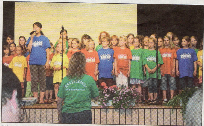
Die Klein-Winterheimer Rasselbandenkinder sangen für die neuen Gymnasisten.